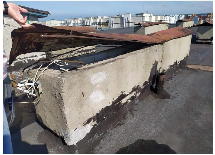
Фото до ремонту